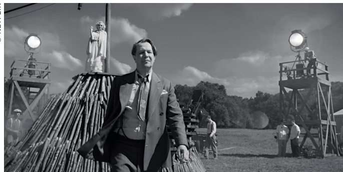
■ Gary Oldman loistaa Mank-elokuvan Herman Mankiewiczina.

Takaumissa ollaan 1930-luvulla, jolloin Mankilla meni kovaa ja hän pyöri superrikkaan William Randolph Hearstin (Charles Dance) ja tämän nuoren näyttelijäpuolison Marion Daviesin (Amanda Seyfried) seurapiirissä. Näissä jaksoissa on satumaisuutta. Mankin ja Daviesin yöllinen tuokio mil-